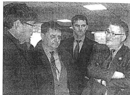
La planta fue inaugurada el pasado día 16.

Este nuevo proyecto de generación de calor y agua caliente a partir de bio-